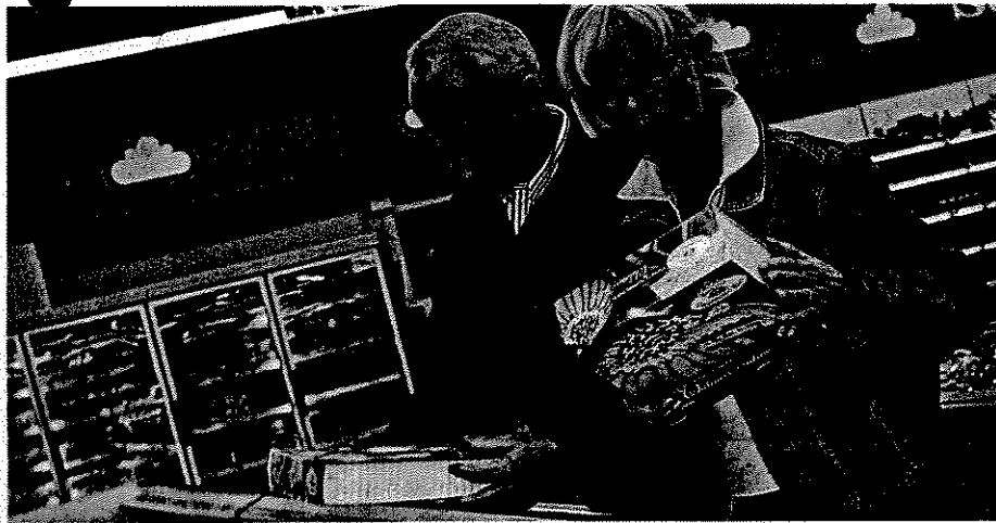
Kritischer Blick auf das Äußere: Bei älteren Zielgruppen liegt die Messlatte für Verpackungen besonders hoch